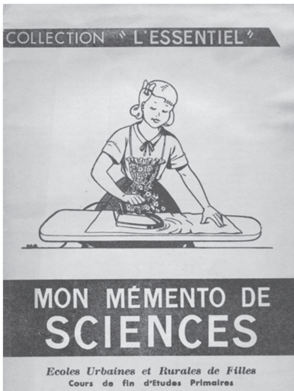
Couverture de Mon memento de sciences , J. ANSCOMBRE, 1966.

Mon memento de sciences : manuel scolaire de sciences utilisé dans une école primaire pour filles à Bruxelles à la fin des années 1960.