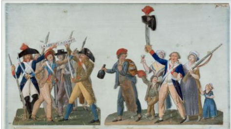
LESUEUR Jean-Baptiste, Le cri français , 1792

Dans une Europe où le rayonnement de la France est très important, la Révolution française (1789) a eu un immense écho. Cet héritage révolutionnaire, la diffusion des idées des Lumières et les guerres quasi incessantes de 1792 à 1815 ont bouleversé politiquement et idéologiquement le continent européen.