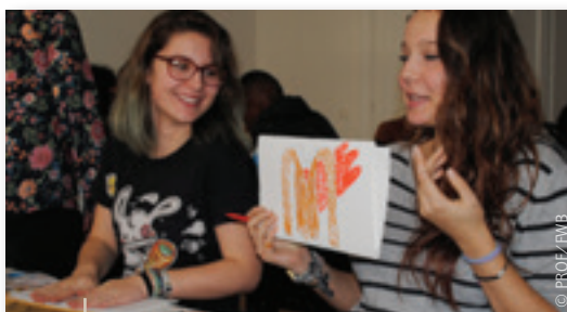
Après la visite du port d'Anvers, des élèves français illustraient les traces de la mondialisation en composant des « cadavres exquis ».