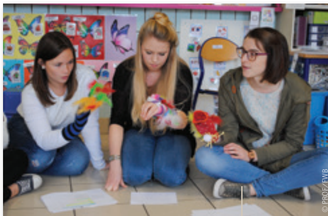
Les futures institutrices maternelle, étudiantes en 3 e bachelier dans leurs hautes écoles de Liège et de Hasselt, ont organisé des ateliers en 3 e maternelle.

groupes mixtes, ont créé des ateliers. Les unes ont préparé la lecture d'une histoire, en néerlandais, accompagnée par des marionnettes.