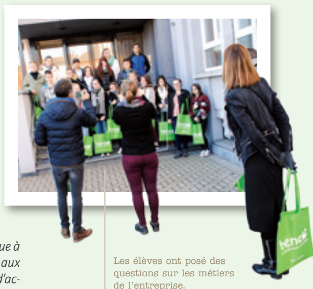
Les élèves ont posé des questions sur les métiers de l'entreprise.

une animation sur l'orientation. Puis la Cité des Métiers explique ce qu'est une entreprise et fait un point sur les 14 partenaires. Vient alors la visite au choix. Enfin, accompagnateurs et élèves, répartis entre plusieurs visites, réalisent un débriefing en classe. Il se nourrit d'un portfolio hébergé par les Chambres Enseignement concernées sur une plateforme réservée aux participants.