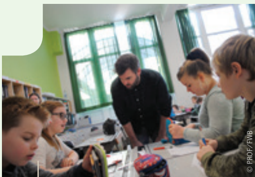
Après la visite, ces élèves vont plus loin.