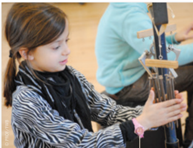
À la Semaine du Son, les enfants jouent avec les sons et les écoutent... mieux.

Sur fond de paysage sonore (bruits de ferme, de ville, pluie,...) quatre par quatre, des enfants jouent avec les instruments qu'on leur propose : maracas, bouts de bois, tambour, clous, plastique, piano africain, billes d'acier aimantées, billes roulant sur un plateau,... Ce vendredi 3 février, trois classes de l'École primaire Singelijn (Woluwe-Saint-Lambert) et une de l'Institut Diderot (Bruxelles) participent à une initiation à la musique électroacoustique, organisée dans le cadre de la Semaine du Son (1) .