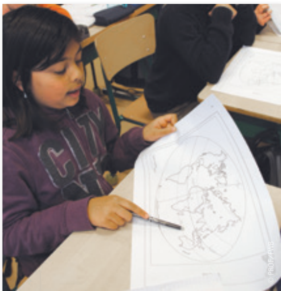
Sur le planisphère, le voilier de tête progresse vers Les Sables-d'Olonne, d'où est parti le Vendée Globe.

âgé de la course. C'est chouette. Finalement, l'important, ce n'est pas l'âge ! »