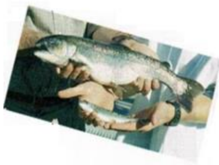
Photographie : deux saumons de la même espèce et du même âge, l'un transgénique et l'autre « sauvage ».