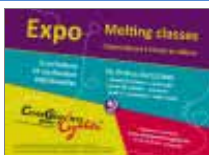
Table Ronde et Animations dans le cadre de l'Expo Melting Classes

Informations et programme: http://www.playtown.be/