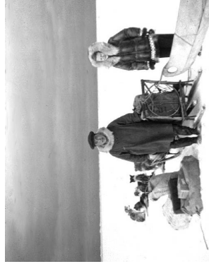
Centers for Disease Control and Prevention (1956)

A une certaine époque, les Inuits avaient une maison d'été et une maison d'hiver. Pendant l'été, ils vivaient souvent dans des tentes faites en peaux de caribou tendues sur une armature en bois. En hiver, de nombreux Inuits vivaient dans des huttes de terre. Ils creusaient un trou dans le sol et, autour du trou, ils empilaient des pierres et des mottes de terre pour faire les murs. Ils utilisaient des pièces de bois ou des os de baleine pour faire l'armature du toit qu'ils recouvraient avec des mottes de terre. Les Inuits sont célèbres pour leurs igloos. Un igloo est constitué de blocs de neige assemblés de manière arrondie en forme de dôme. Ils s'en servaient surtout comme abris temporaires pendant les expéditions de chasse en hiver.