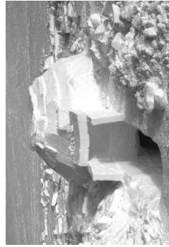
National Oceanic and Atmospheric Administration