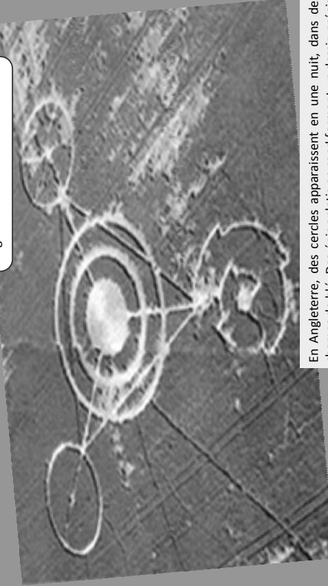
17 juillet 1991 Des cercles mystérieux en Angleterre

En Angleterre, des cercles apparaissent en une nuit, dans des champs de blé. Des épis aplatis en rond forment un dessin précis. Aujourd'hui, on sait que tous ces cercles ont été faits par des farceurs. Ils les créaient avec une planche qu'ils déplaçaient devant eux.