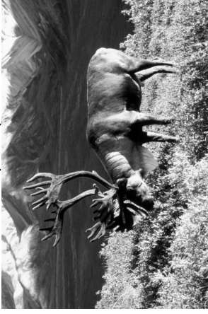
Dean Biggins (U.S Fish and Wildlife Service)

Jadis, les vêtements des Inuits étaient confectionnés exclusivement à partir de matériaux fournis par la faune. Le Caribou et le phoque étaient les deux principales sources de peau et de fourrure.