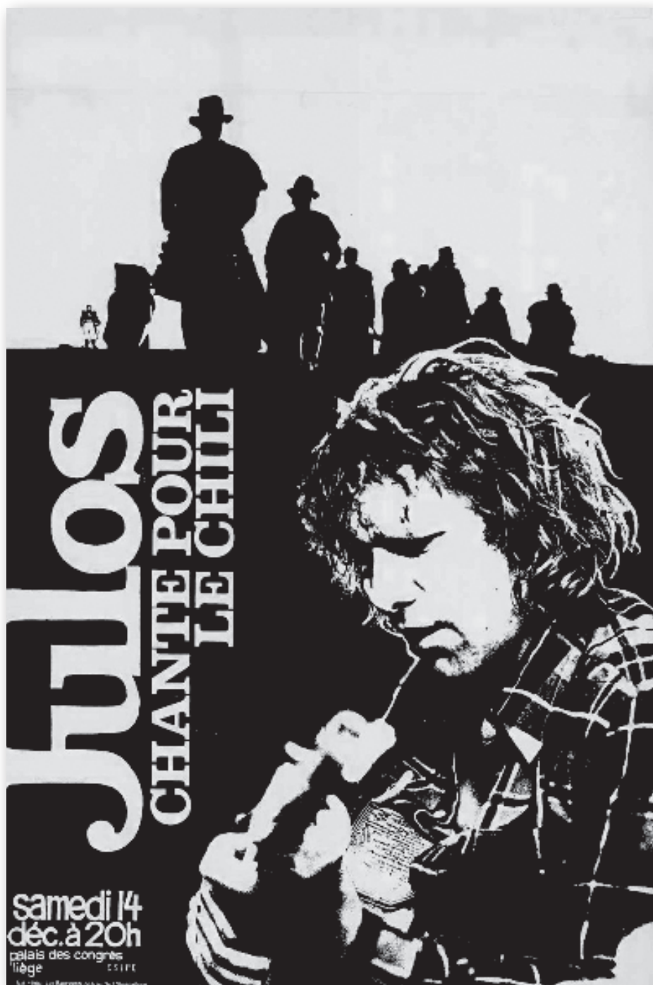
Julos chante pour le Chili , poster du Comité de Soutien à la Lutte du Peuple Chilien, Liège, 1974.

Julos BEAUCARNE : artiste, poète, chanteur et sculpteur belge, né en 1936. Au lendemain du coup d'État de Pinochet, il compose Lettre à Kissinger , chanson racontant le sort de Victor JARA, chanteur chilien, torturé et exécuté en septembre 1973.