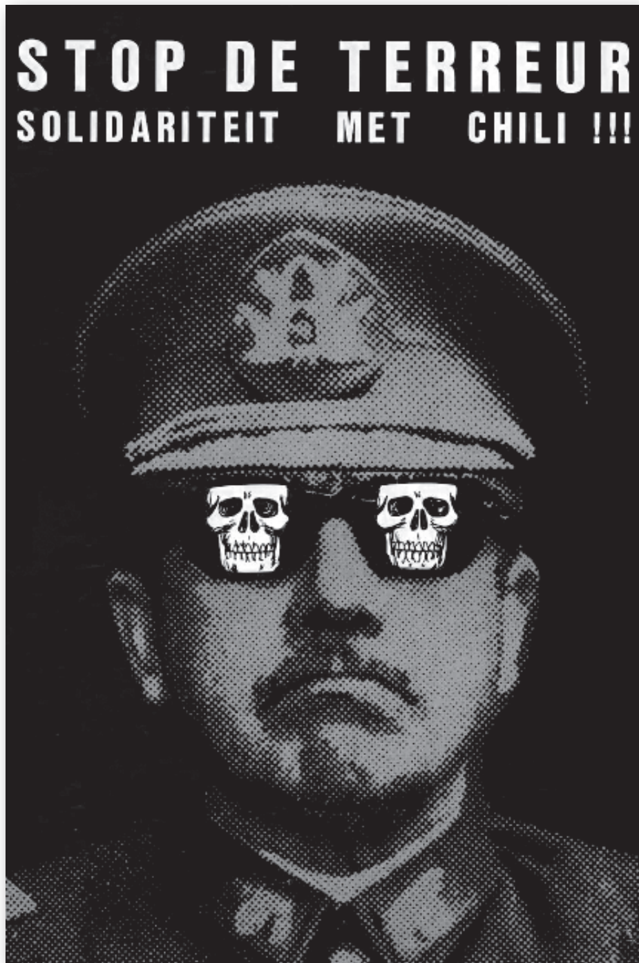
Affiche de la campagne pour le Chili éditée par la Jeunesse communiste flamande, Kommunistische Jeugd van België, 1974.