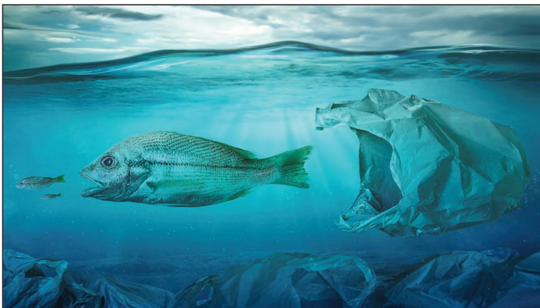
Fish swims among plastic bag ocean pollution. Environment concept