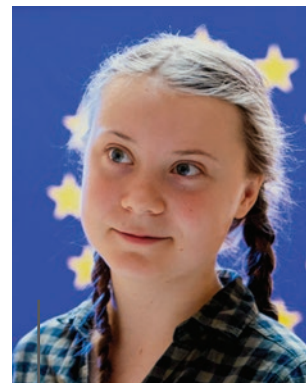
European Parliament from EU

Nous nous battons pour tout le monde. Pour vous.