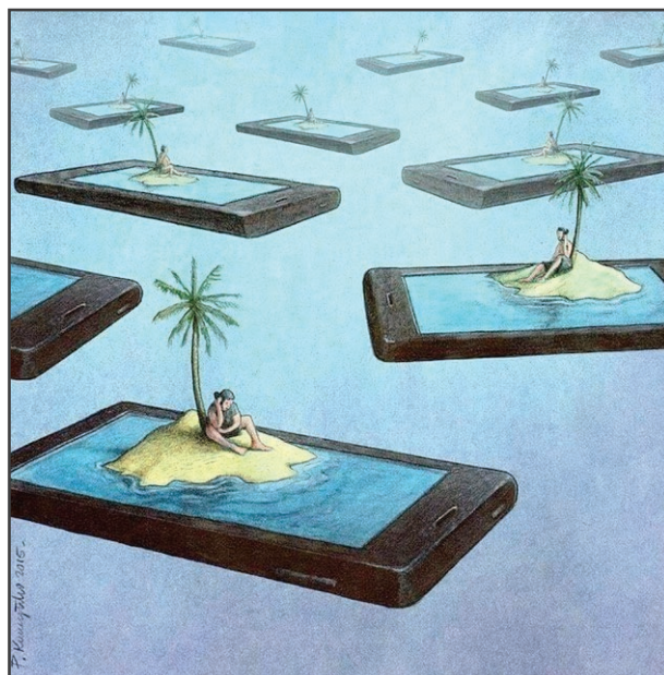
Islands, de Paul KUCZINSKY