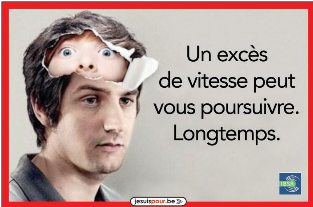
Campagne vitesse de l'Institut Belge pour la Sécurité Routière (IBSR), 2007