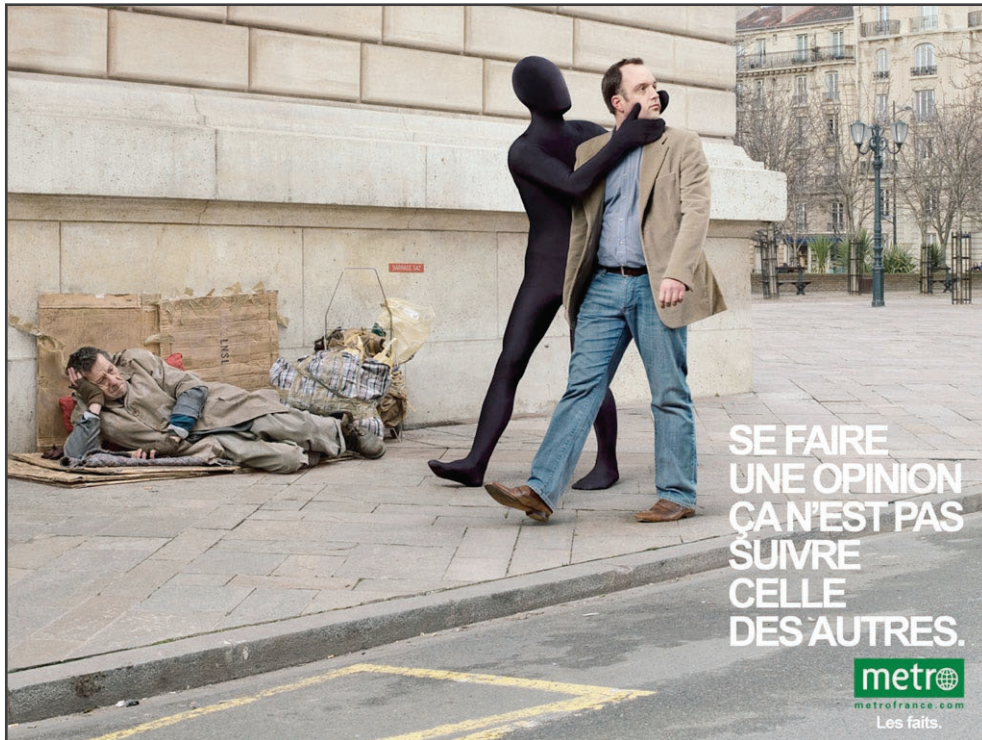
Titre : SDF / Annonceur : Metro International S.A. / Agence : CLM BBDO