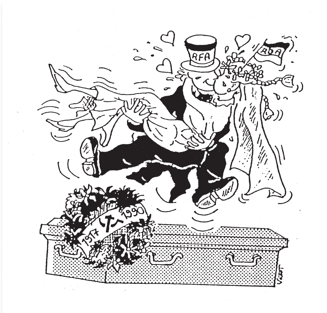
Caricature de Nicolas VADOT, Le mariage , 1990.

Nicolas VADOT : dessinateur de presse franco-britannico-australien, né en 1971. Il collabore depuis 1993 avec l'hebdomadaire Le Vif/l'Express et par la suite également avec le quotidien L'Écho .