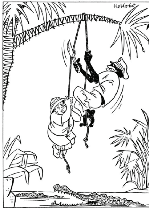
FREIHEIT AM KONGO