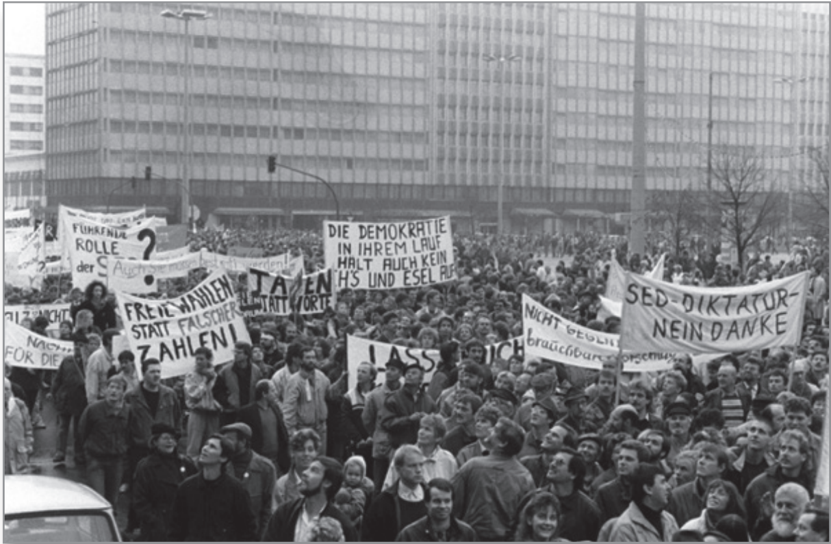
Source : Photographie prise sur l'Alexanderplatz à Berlin-Est, le 4 novembre 1989.