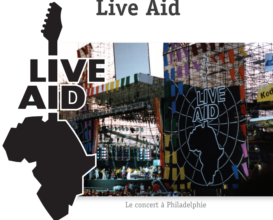
Le concert à Philadelphie